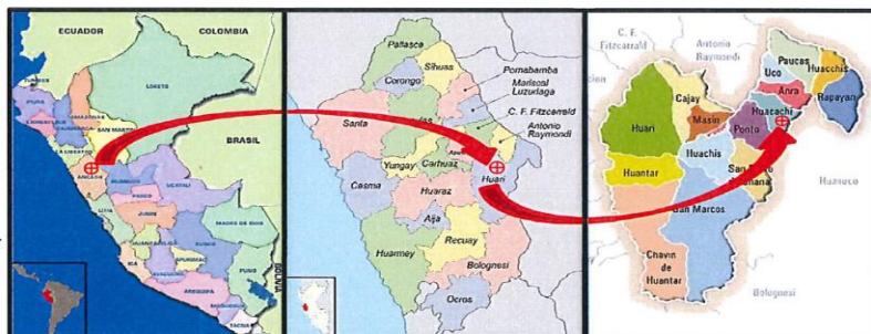
Distrito de Huacachi, provincia de Huari, departamento de Ancash.