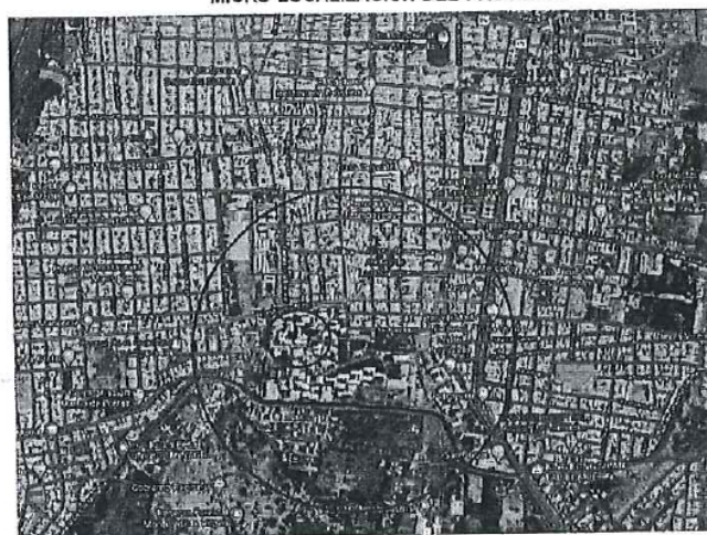
GRAFICO 01: Ámbito de influencia del proyecto Ciudad de Lambayeque vs Ciudad Universitaria