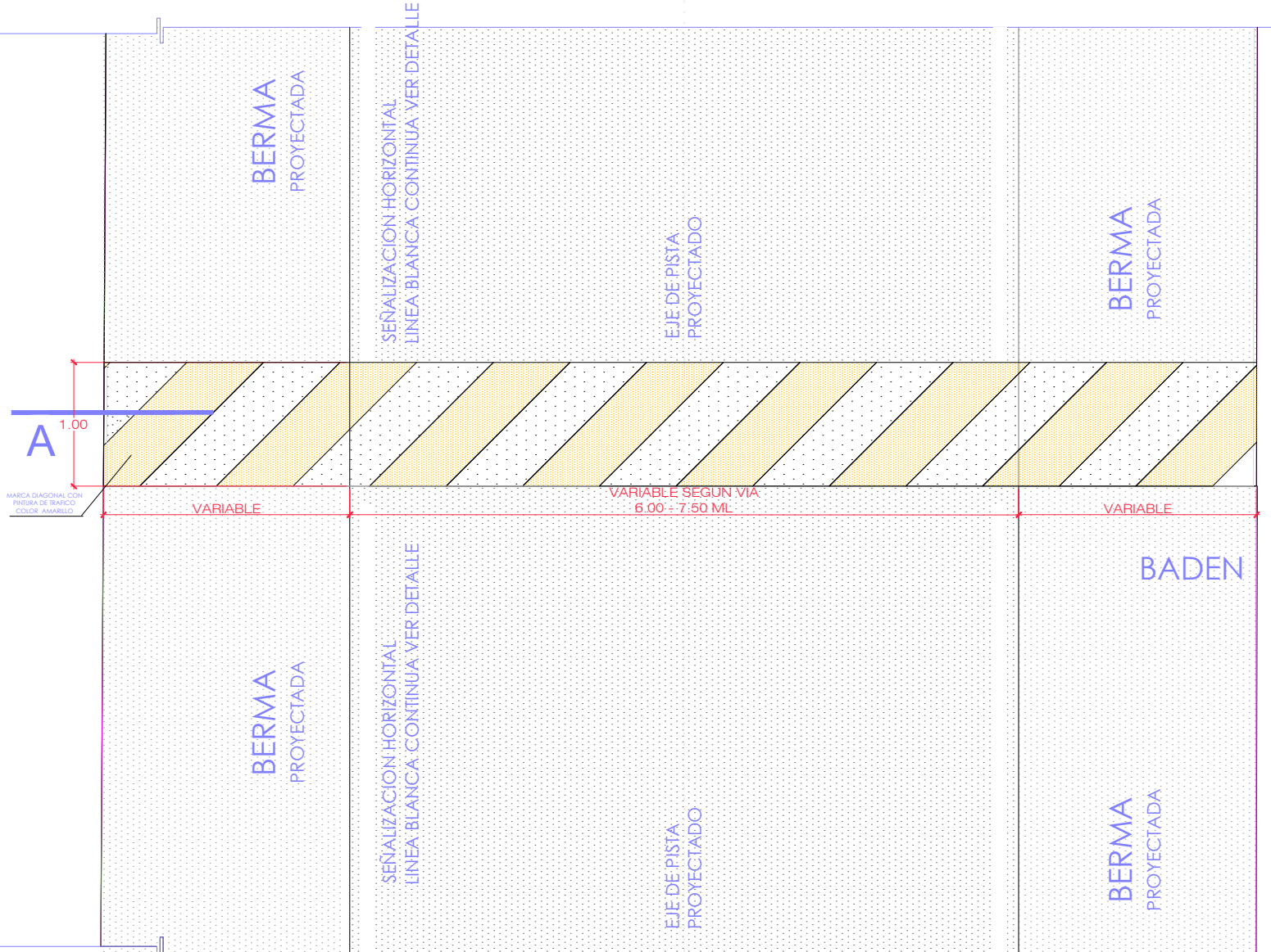
REDCUTOR DE VELOCIDAD -BADEN ESCALA 1/50