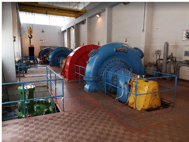
Imagen 04: Vista general de la Casa de Maquinas, donde se aprecian vigas de soporte de puente grúa y columnas peraltadas cuya cimentación se debe evaluar.