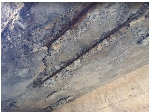
Imagen 06: Varillas de refuerzo de acero expuestas en piso de casa de máquinas.