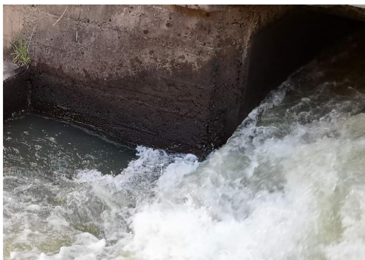
Imagen 02: Vista de flujo turbulento de agua en canal de descarga exterior, que provocan pérdida de superficie de concreto.