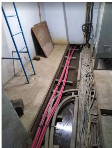
Imagen 08: Presencia de filtraciones de agua en galería de cables de alta tensión, ocasionando alto riesgo de accidentes.