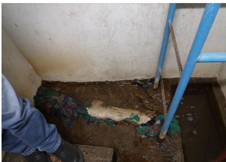
Imagen 01: Condiciones de filtración de agua en zona de sótanos y afectación de instalaciones eléctricas.