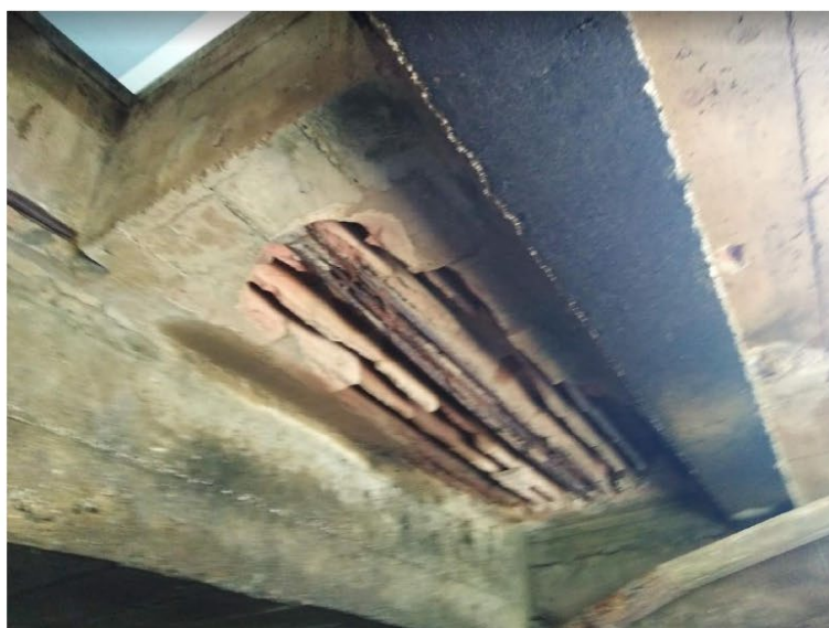
Imagen 10: Varillas de refuerzo de acero expuestas en piso de casa de máquinas.