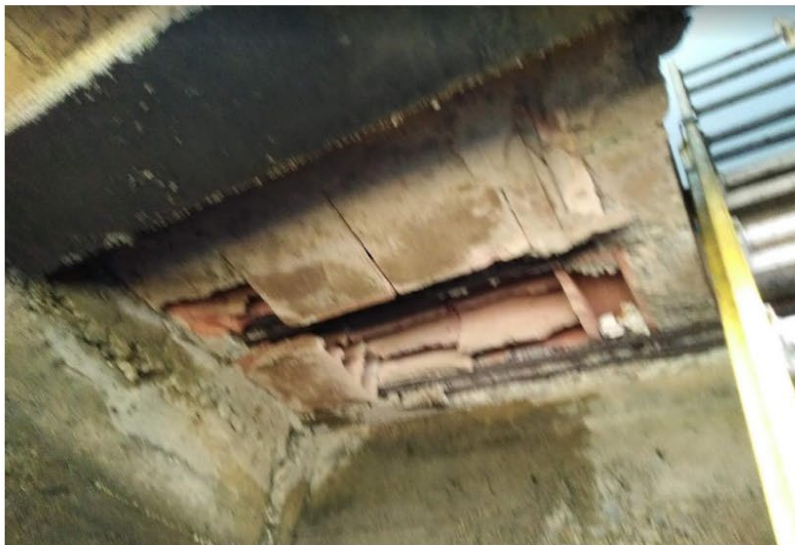
Imagen 11: Zonas de pérdida de superficie de recubrimiento de concreto.

Generando Energía con Responsabilidad Social