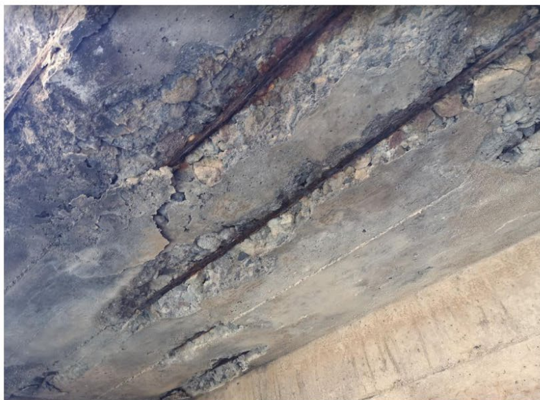
Imagen 12: Varillas de refuerzo de acero expuestas en piso de casa de máquinas.