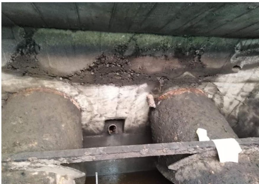
Imagen 07: Elementos de concreto con pérdida de recubrimiento superficial por acción de la turbulencia del agua.

Generando Energía con Responsabilidad Social