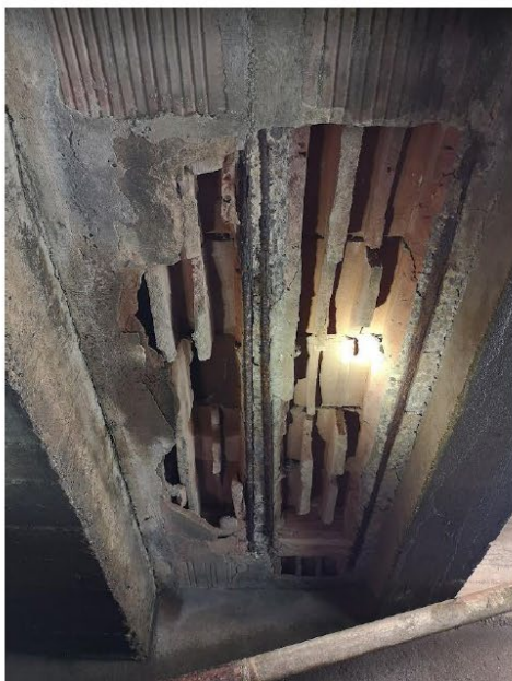
Imagen 05: Zonas de losa de piso con desprendimiento de partes fijas, que deberán ser analizadas.

Generando Energía con Responsabilidad Social