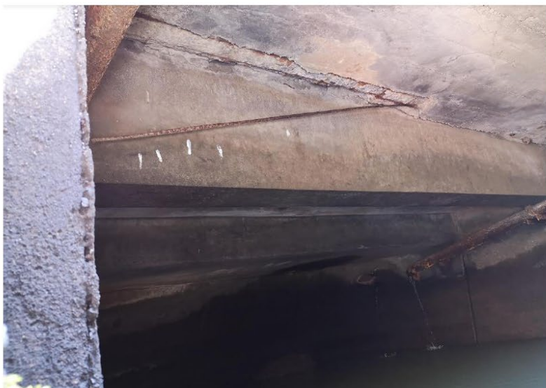
Imagen 03: Pérdida de recubrimiento de concreto en losas de piso, con la exposición del acero de refuerzo.

Generando Energía con Responsabilidad Social