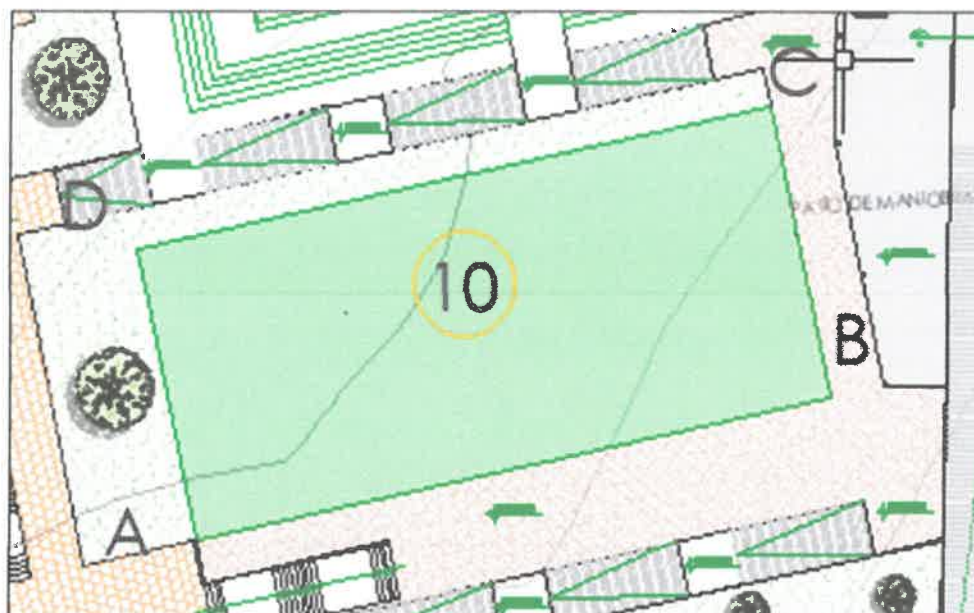
Pabellón del comedor de la Universidad Nacional de los Andes.