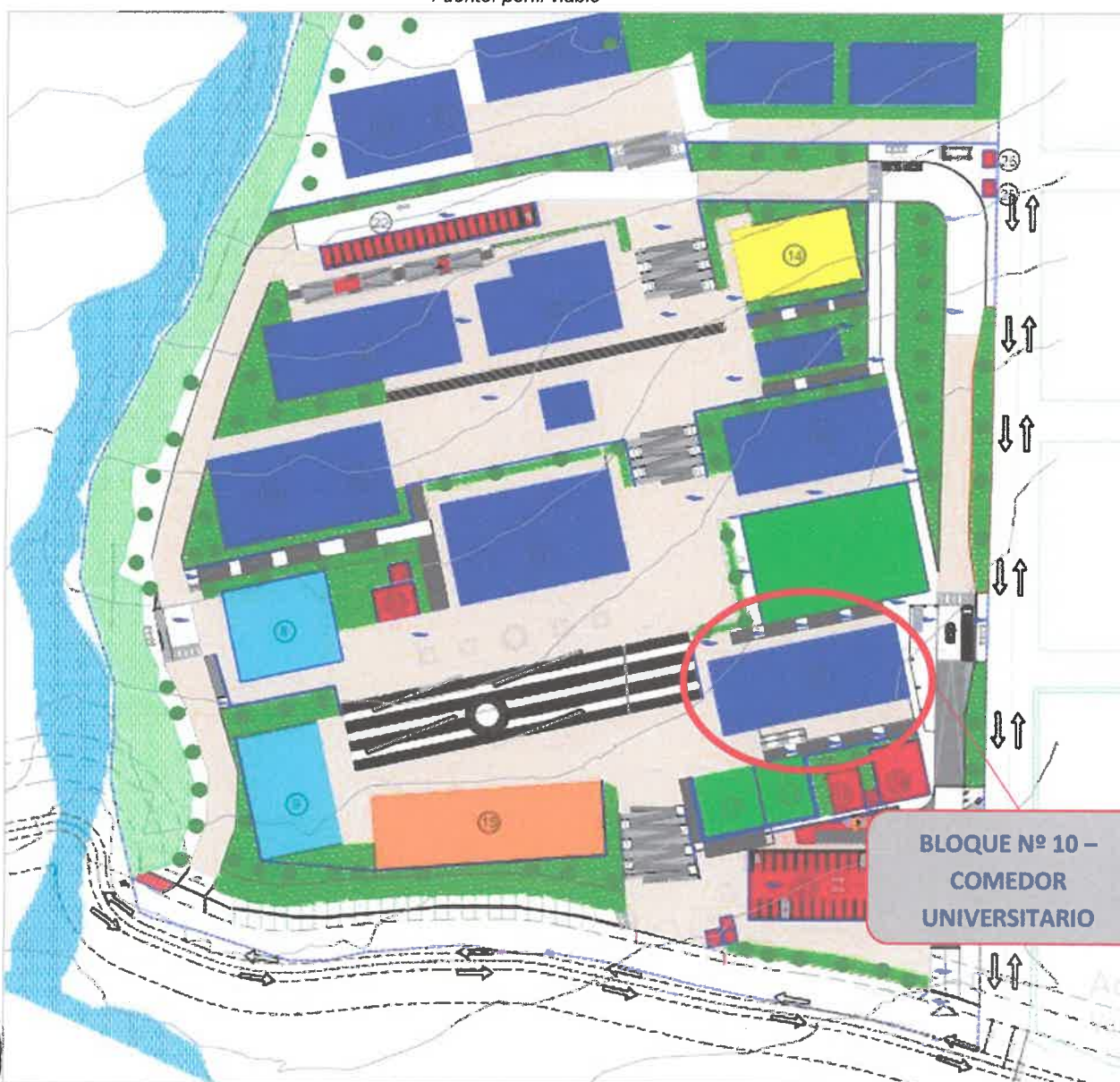
Distribución de ambientes del Plan Director UNCA