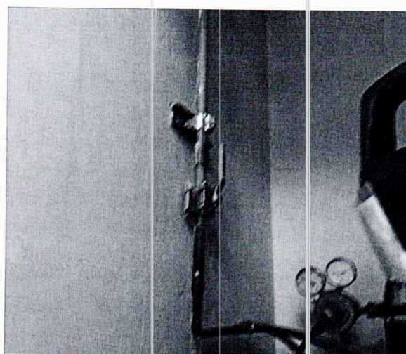
Imagen 2: El EE.SS. Los accesorios y tuberías se encuentran desprendidos en diferentes puntos.