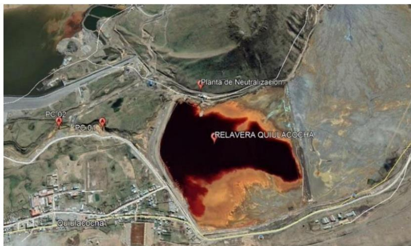
Figura 1. Ubicación en Google Earth de la actual de la Planta de neutralización de la relavera Quiulacocha

El acceso desde la ciudad de Lima se realiza por la Carretera Central, a una distancia aproximada de 304 Km al norte de la ciudad de Lima y 130 Km al norte de la ciudad de La Oroya. Las temperaturas promedio en esta zona es de -5.0°C como mínimo y de 19.5°C como máximo.