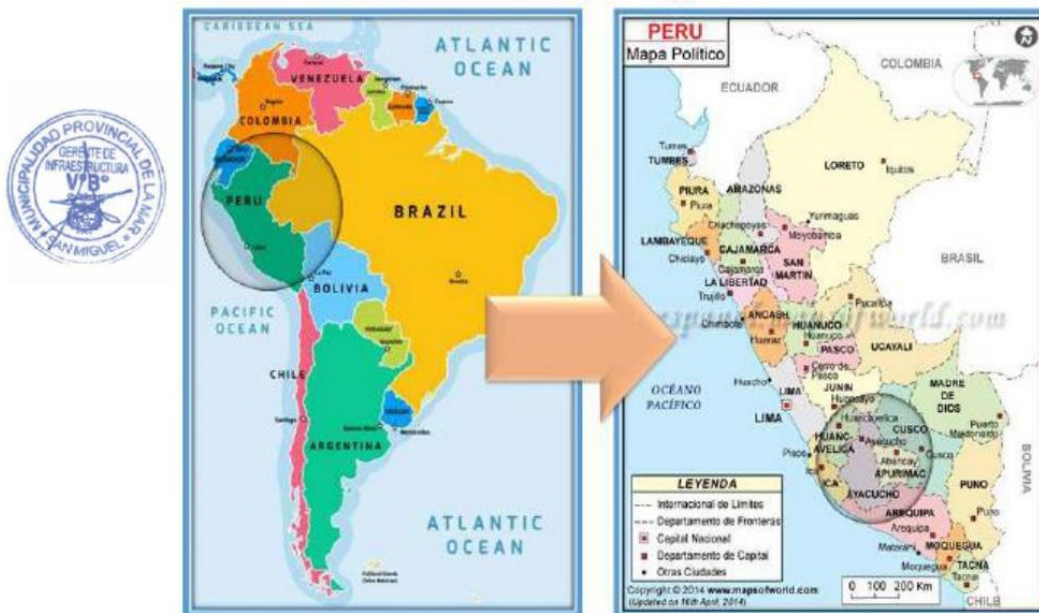
IMAGEN N°01 UBICACIÓN DEL MANTENIMIENTO PERIÓDICO.