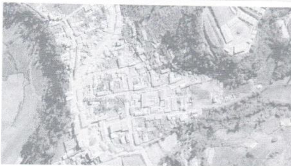
Imagen: Ubicación de la Obra.