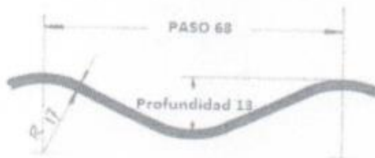
Figura 1. Dimensiones de la corruga 68 mm x 13 mm

Las corrugas de las planchas deben formar curvas suaves continuas. La corruga está designada por el paso (distancia de cresta a cresta) y la profundidad de la corruga. Tal como se muestra en la Figura 1, el tamaño nominal de la corruga es 68 mm x 13 mm para las alcantarillas TMC, SP MP-68.