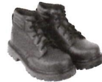
Zapatos de Seguridad con Puntera de Acero