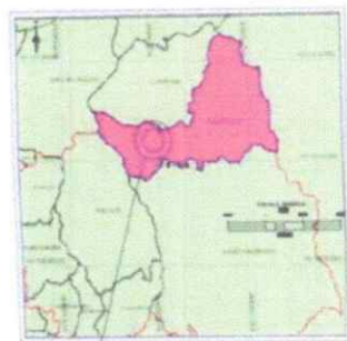
UBICACION DEL PUENTE