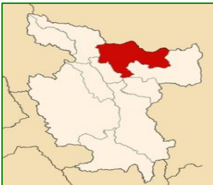
MAPA DEL DEPARTAMENTO DE SAN MARTÍN