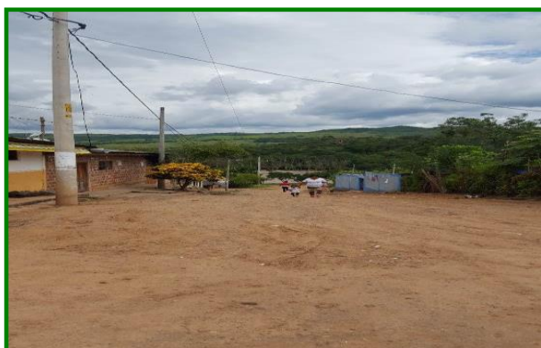
Jr. San Martín C-1 ahuellamientos y charcos en calzada, cunetas inexistentes.