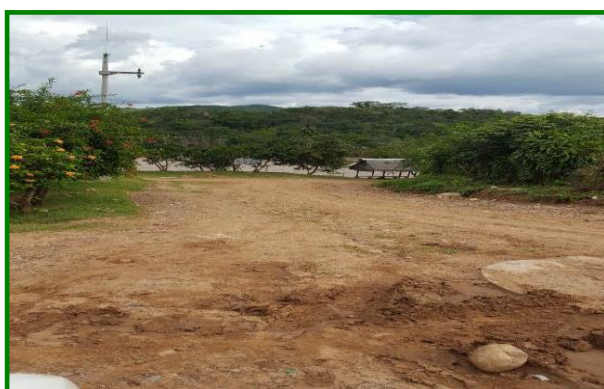
Jr. San Martín C-2 calzada en mal estado, cunetas inexistentes.