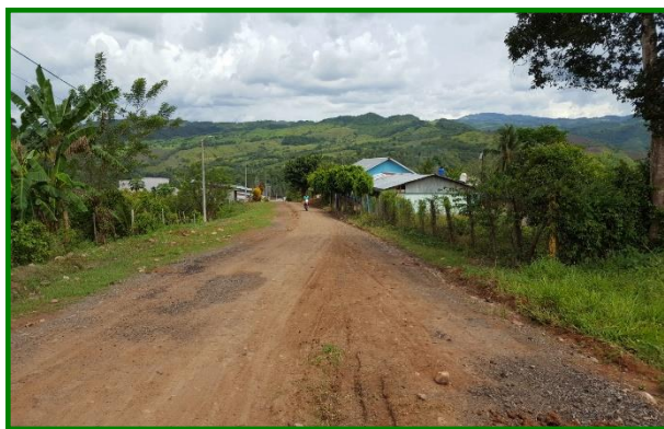
Jr. San Martín C-5, cunetas y veredas inexistentes