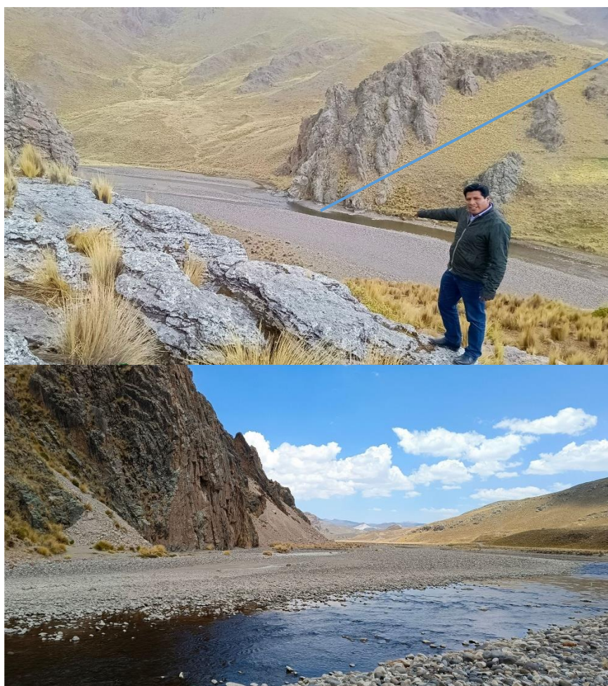
FUENTE DE AGUA

El punto de captación de la fuente de agua es la cuenca y sub cuencas del rio llave, a partir de ahí se deriva sus aguas a través de la infraestructura de conducción precaria.