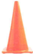
CONO DE SEGURIDAD