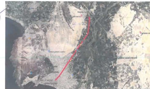
Imagen N°02.- Zona de Intervención, DESDE EL C.P. CAMBIO PUENTE HASTA LA AV. BUENOS AIRES (dentro de la sección de color Rojo)