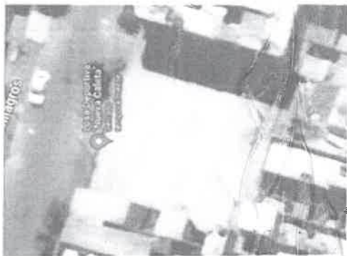
Figura N° 01: Micro - Localización