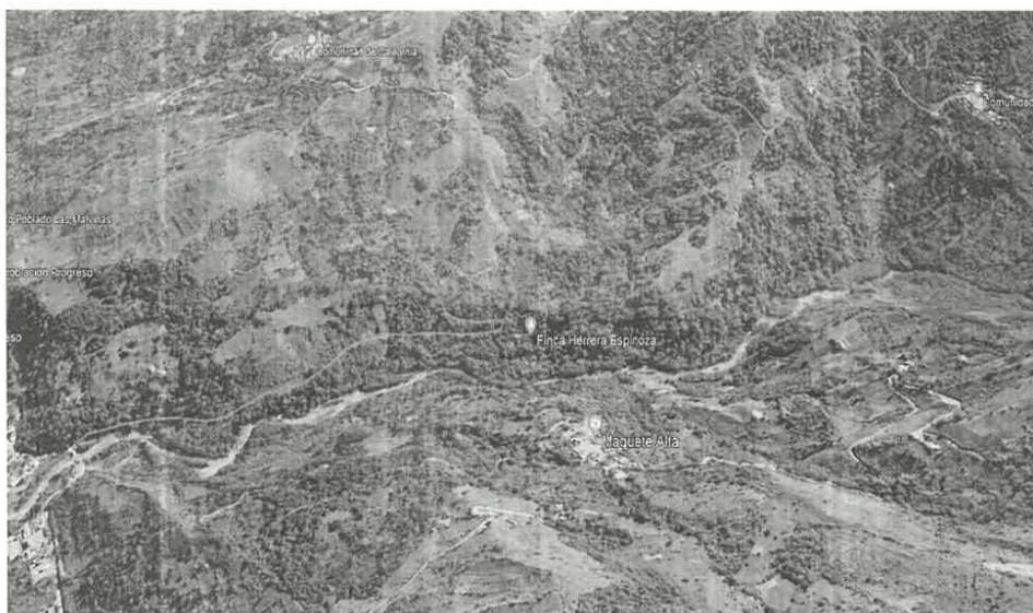
Imagen N° 01: Ubicación localidades beneficiarias en GOOGLE EARTH.