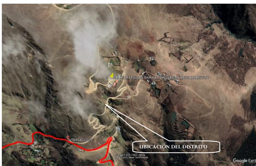
FIGURA N° 2 UBICACIÓN GEOGRÁFICA DEL PROYECTO

El presente Proyecto a ejecutarse se encuentra en el distrito de Santa Ana de Tusi, está ubicada en una altitud aproximada de 3 500 msnm. El distrito de Santa Ana de Tusi es uno de los distritos que conforman la provincia de Daniel Alcides Carrión, perteneciente a la Región Pasco.