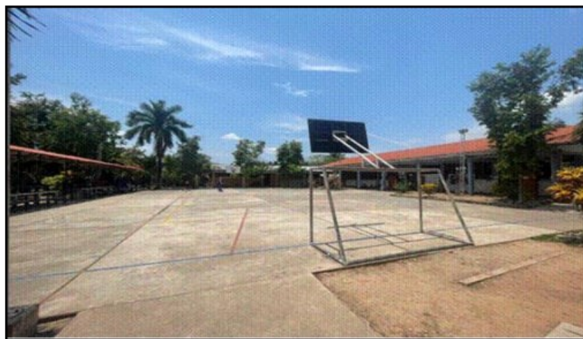
Imagen 1 - Frontis Losa deportiva de la institución educativa I.E. CESAR RUÍZ REÁTEGUI

La imagen anterior muestra una infraestructura que requiere dotar de una infraestructura de techado con cobertura metálica liviana complementaria que garantice la seguridad de los estudiantes, docentes y personal administrativo de la I.E. Por lo que se ha visto por conveniente formular e implementar el presente IOARR: CONSTRUCCIÓN DE ESPACIO DEPORTIVO CON COBERTURA; EN EL(LA) I.E. CESAR RUIZ REATEGUI EN EL CENTRO POBLADO PUCACACA, DISTRITO DE PUCACACA, PROVINCIA PICOTA, DEPARTAMENTO SAN MARTIN.