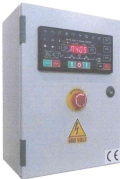
Imagen Referencial del TTA

"Año de la Recuperación y Consolidación de la Economía Peruana"