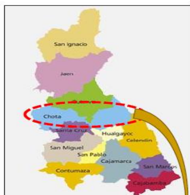
IMAGEN N°2. EN LA PROVINCIA DE CHOTA