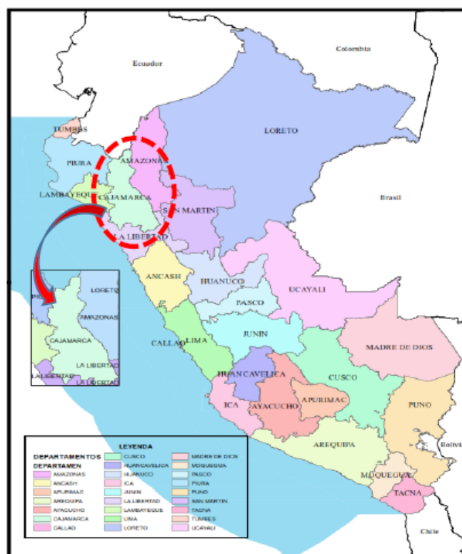
IMAGEN N°1. UBICACIÓN EN EL PAÍS: REGIÓN CAJAMARCA

La vía, considerada en el presente proyecto se encuentra ubicada dentro de la localidad de Cutervillo y El Molle, Distrito de Huambos, Provincia de Chota – Región Cajamarca.