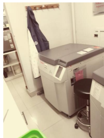
IMAGEN N° 05: Equipos en el ambiente de Área Inmunocerología Fecha: 31/03/2023