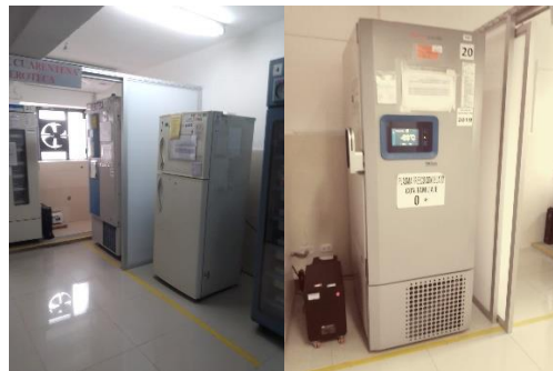
IMAGEN N° 03: Equipos en el ambiente Área de conservación Fecha: 31/03/2023