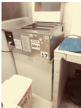
IMAGEN N° 04: Equipos en el ambiente de Área Centrifugado Fecha: 31/03/2023