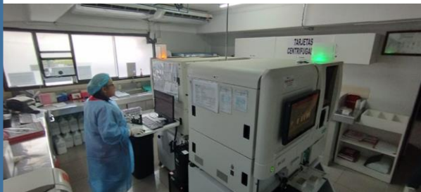
IMAGEN N°2: Equipos en el Ambiente Área de Inmunohematología Fecha: 31/03/2023