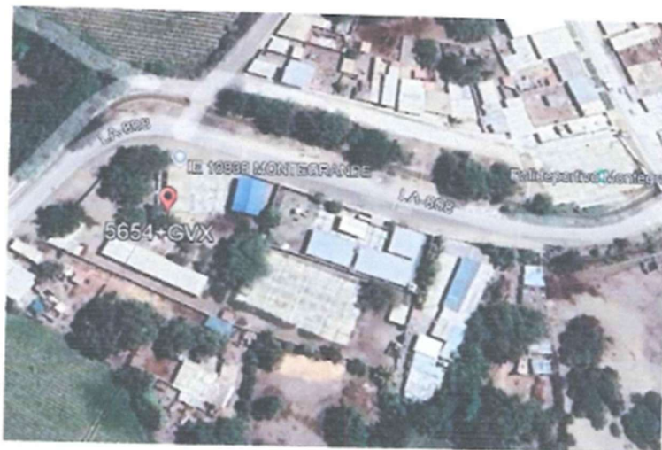
Imagen 1: Ubicación del Proyecto.