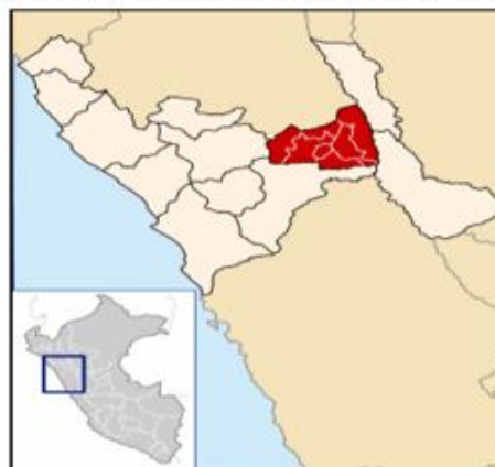
IMAGEN N° 03: DISTRITO DE CURGOS