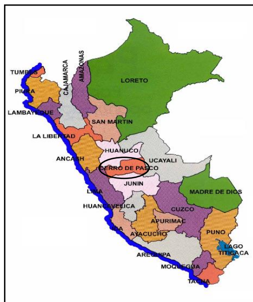
Figura 1: Ubicación Nacional

El proyecto materia del presente informe, se encuentra ubicada en el ingreso a la capital del Distrito de TICLACAYÁN, Provincia de Pasco, Departamento de Pasco, donde la altitud es 3380 m.s.n.m.