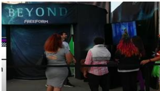
Imagen referencial de lo requerido por PROMPERÚ