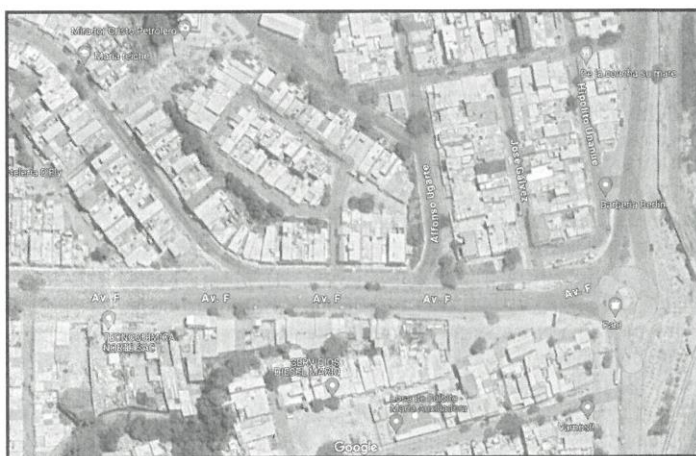
Figura 01. Área de influencia del proyecto