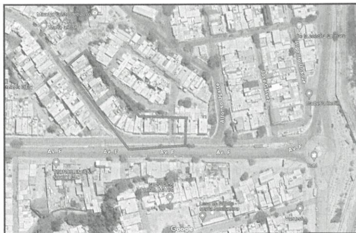
Figura 02 . localización del proyecto