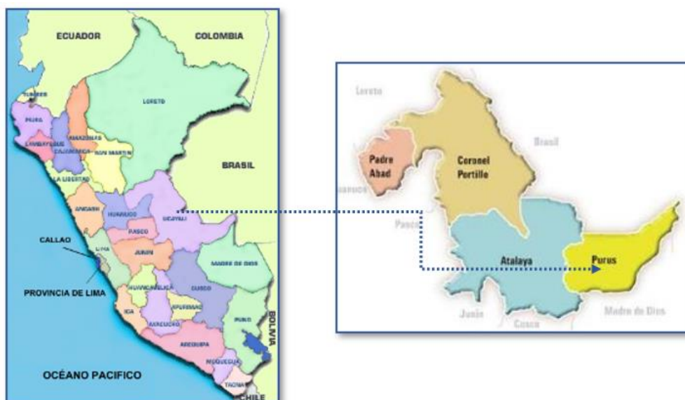
Ilustración N° 01: Macro localización del proyecto