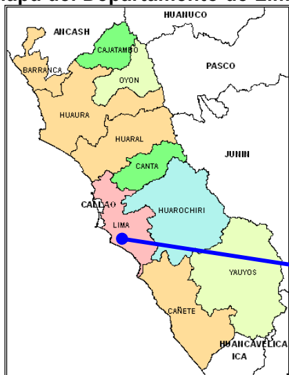
Mapa del Departamento de Lima