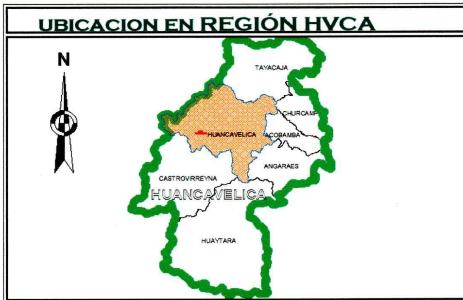
Figura N° 2 - Ubicación política de la Provincia Huancavelica.