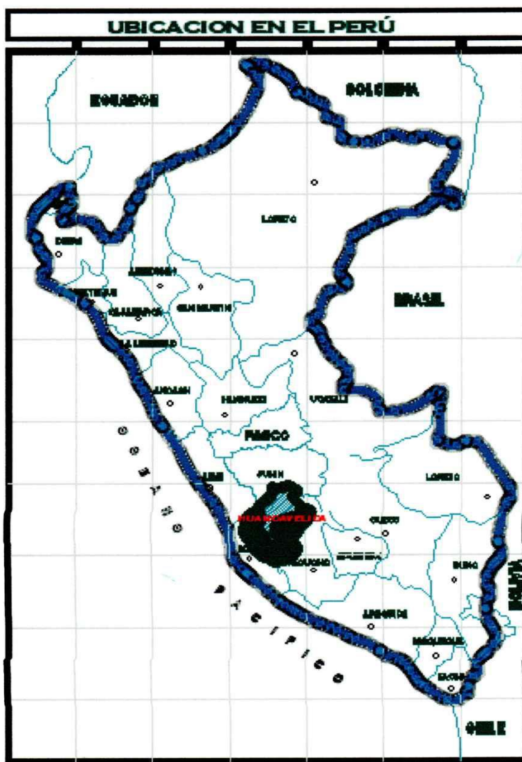
Figura N° 1 - Ubicación política de la Región Huancavelica.

Norte : Con el Centro Poblado San Antonio Sur : Con el Distrito de Acobambilla Este : Con el Distrito de Ascensión - Huancavelica Oeste : Con distrito Acobambilla