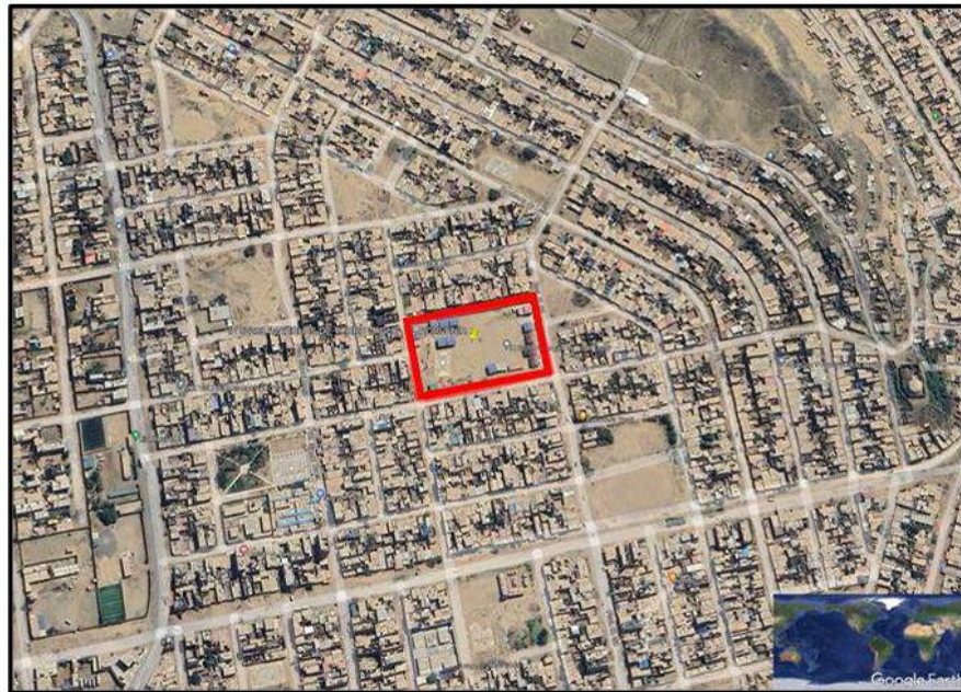
Ilustración 1- Ubicación del terreno

Región : La Libertad Provincia : Trujillo Distrito : El Porvenir (Alto Trujillo) Dirección : Calle España Barrio 3B Mz. 18 Lote 1