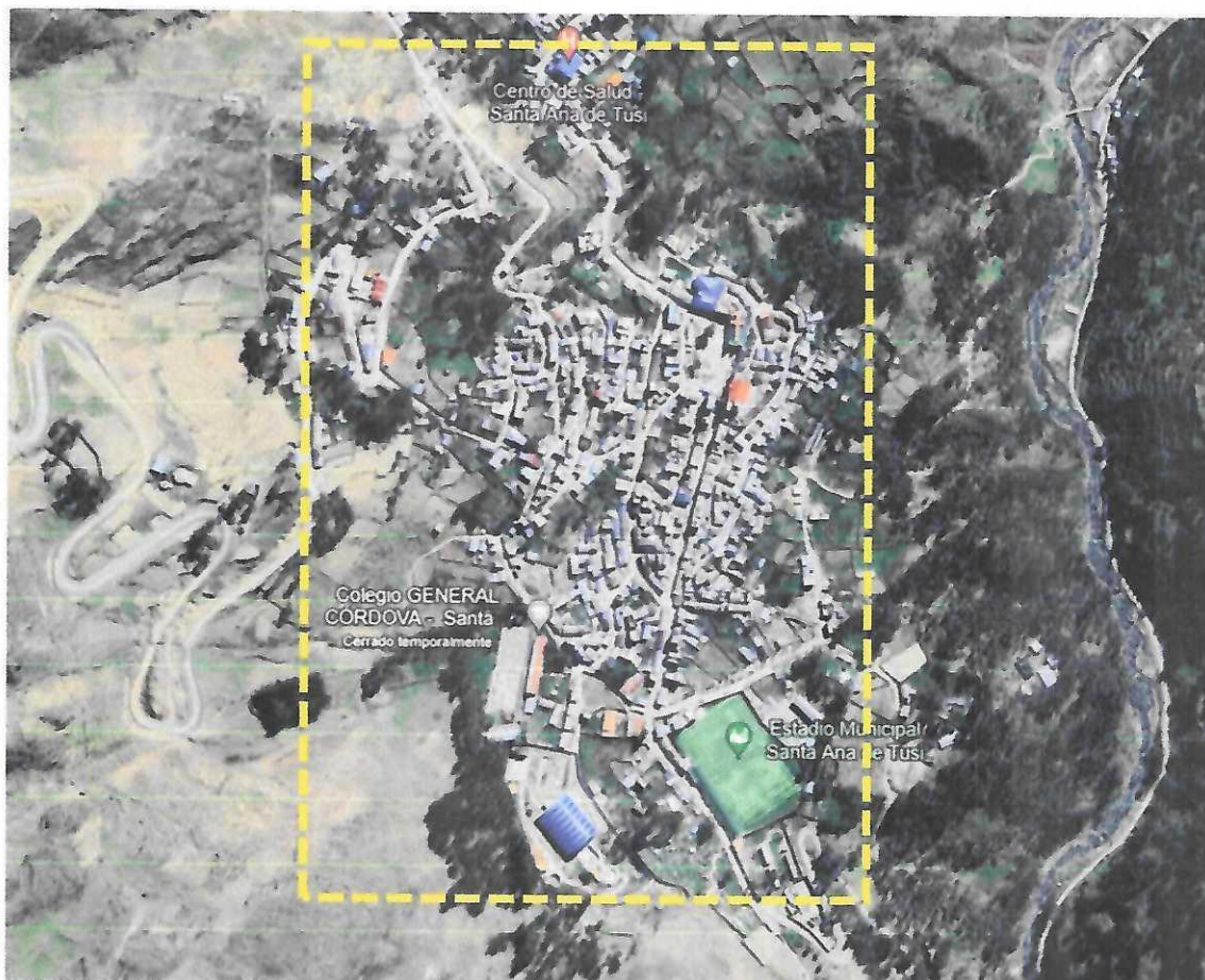
FIGURA N° 2 UBICACIÓN GEOGRÁFICA DEL PROYECTO

El presente Proyecto a ejecutarse se encuentra en el Distrito de Santa Ana de Tusi, está ubicada en una altitud aproximada de 3760.00 msnm. El Distrito de Santa Ana de Tusi es uno de los distritos que conforman la provincia de Daniel Alcides Carrión, perteneciente a la Región Pasco.