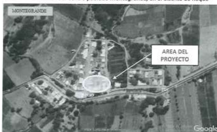
Imagen Satelital del área del proyecto (Centro Poblado Montegrande)