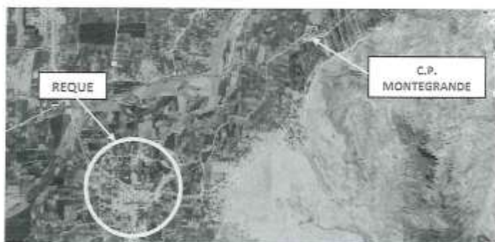
Ubicación del Centro poblado Montegrande, en el distrito de Reque