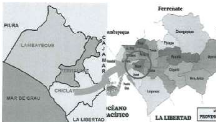
Ubicación del distrito de Reque en la Provincia de Chiclayo

El centro poblado Montegrande tiene una extensión de 75,363.22 m 2 .