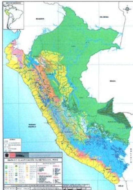
Mapa de Clasificación Climática de la zona de influencia

más predominante esta constituida por Ichu, pastos naturales, etc. En las partes más altas encontramos las pagras, limarimas. Los valores promedios de los parámetros climáticos son monitoreados por las estaciones meteorológicas del SENAMHI. La temperatura media es de 0 a 12 °C, siendo variado de acuerdo a la estación. Por la noche y en los amaneceres se registran temperaturas bajas.