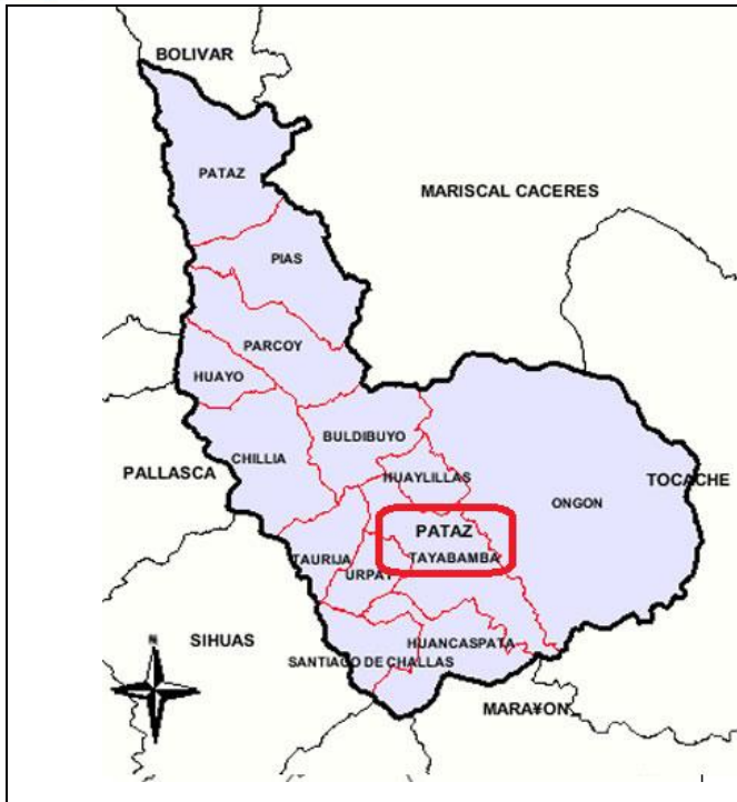
Mapa N° 03: La provincia de Pataz