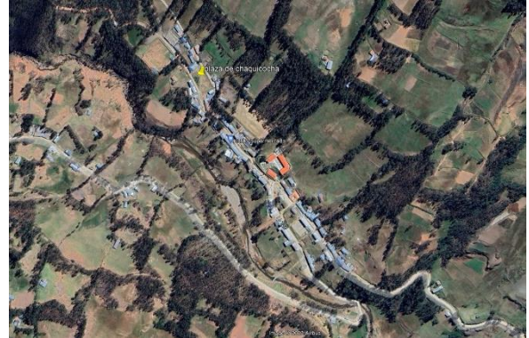
Mapa Satelital N° 04: Distrito Tayabamba - Centro Poblado de Antacolpa