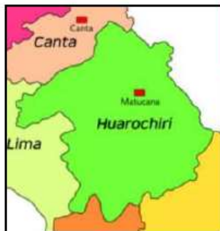
MAPA 2. Mapa de la Provincia de Huarochirí