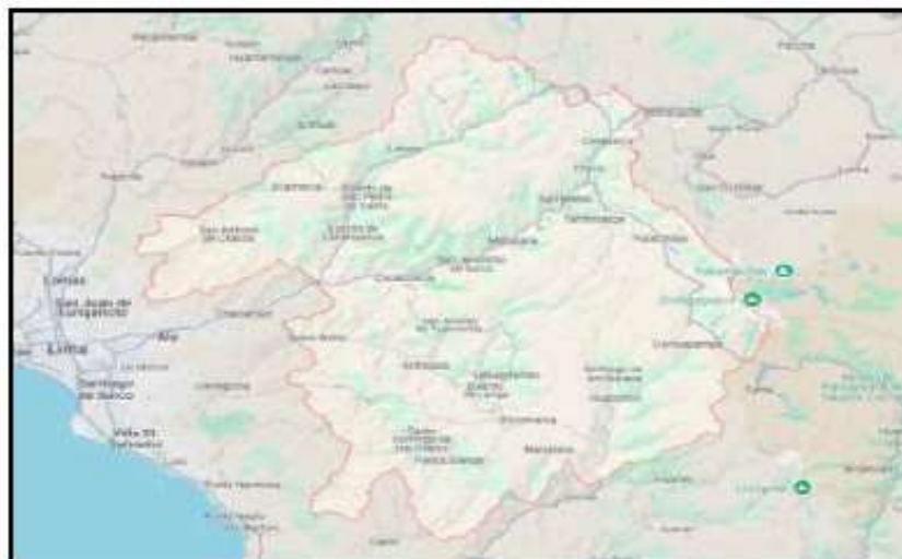
MAPA 3. Mapa de la Provincia de Huarochirí