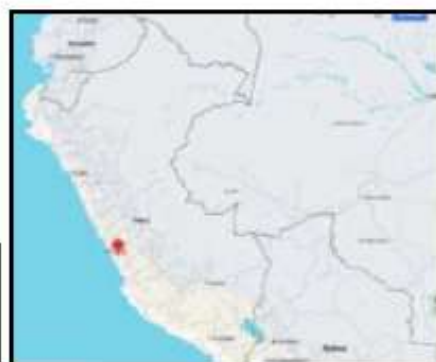
MAPA 1. Mapa del Perú - Departamento Lima, Provincia Huarochirí