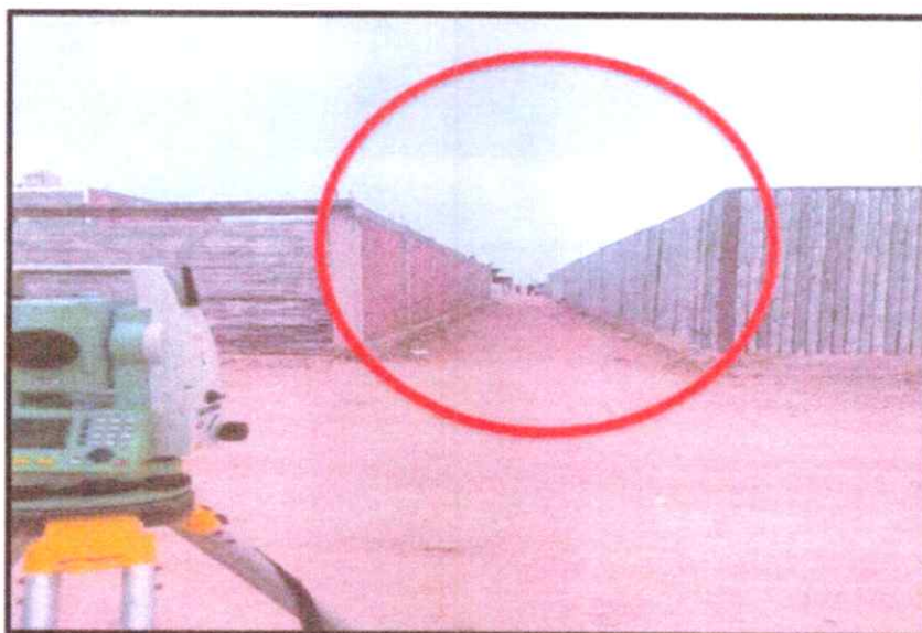
Viviendas expuestas frente a inundaciones

Obra: MEJORAMIENTO DEL SERVICIO DE DRENAJE PLUVIAL EN EL SECTOR AVENIDA REPUBLICA DEL PERÚ DE CENTRO POBLADO ZORRITOS DISTRITO DE ZORRITOS DE LA PROVINCIA DE CONTRALMIRANTE VILLAR DEL DEPARTAMENTO DE TUMBES.