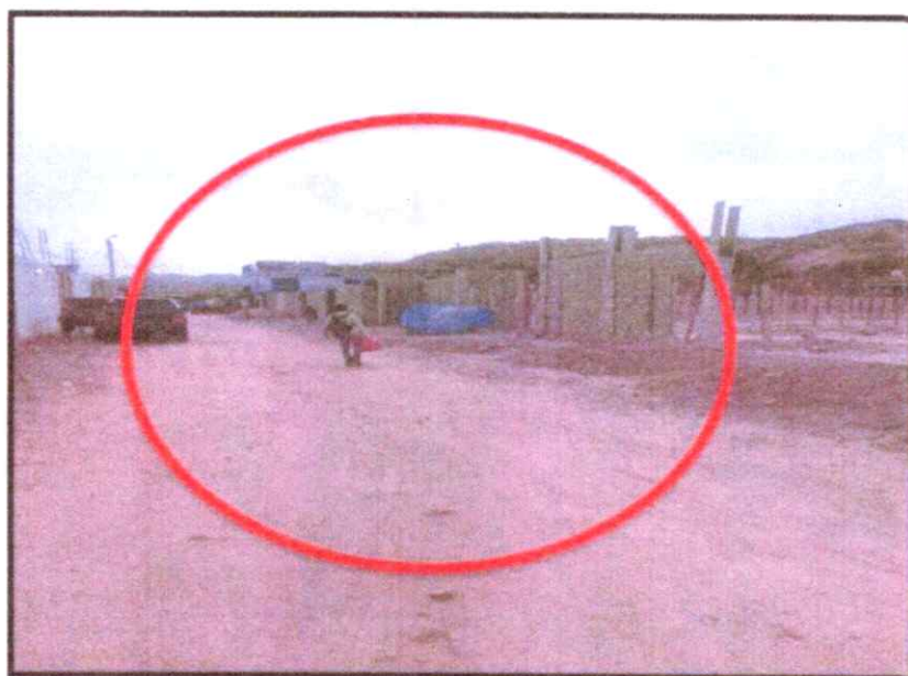
Moradores y viviendas en riesgo por la falta de infraestructura de drenaje pluvial