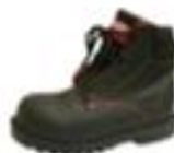
ZAPATO DE SEGURIDAD