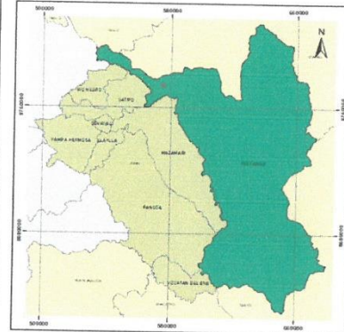
UBICACIÓN GEOGRÁFICA EN EL CONTEXTO PROVINCIAL