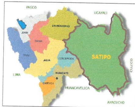
UBICACIÓN GEOGRÁFICA EN EL CONTEXTO REGIONAL DE JUNÍN