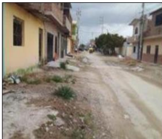
Ubicación: Jr Manieliza Saenz

Evidencias Fotográficas del estado Situacional: