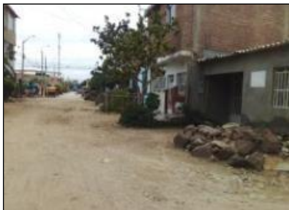
Ubicación: Calle N°01