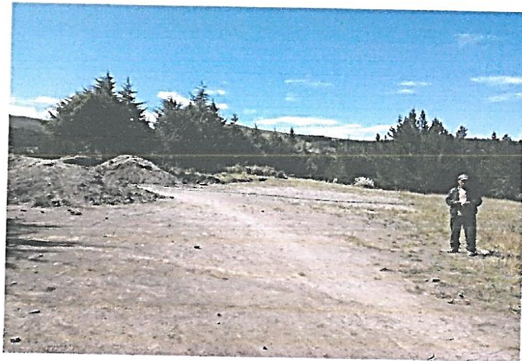
FOTO N° 01: Vista del CAMPO DEPORTIVO , ubicado en Caserío de MARAYHUACA donde se realizan práctica del deporte los pobladores del Caserío.