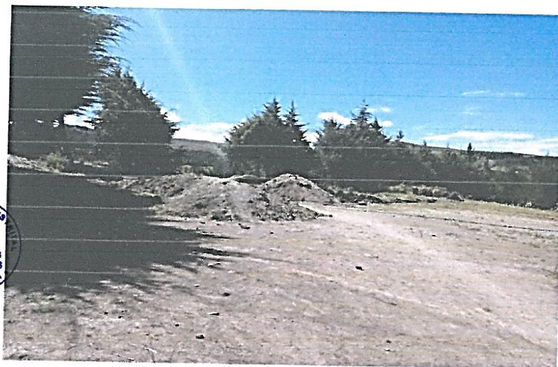
FOTO N° 02: Vista del CAMPO DEPORTIVO ubicado en Caserío de MARAYHUACA donde se realizan práctica del deporte los pobladores del Caserío.