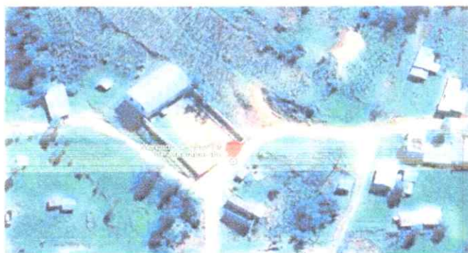
IMAGEN N° 01: UBICACIÓN DEL IOARR (Mercado de Abastos C.P. Mamabamba)

Altitud 2143 msnm. Región Natural Yunga.