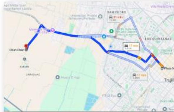
Acceso a Chan Chan