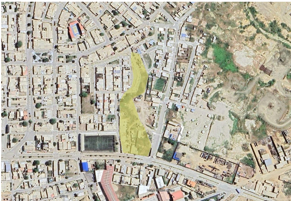
Ilustración 2. Ubicación del proyecto