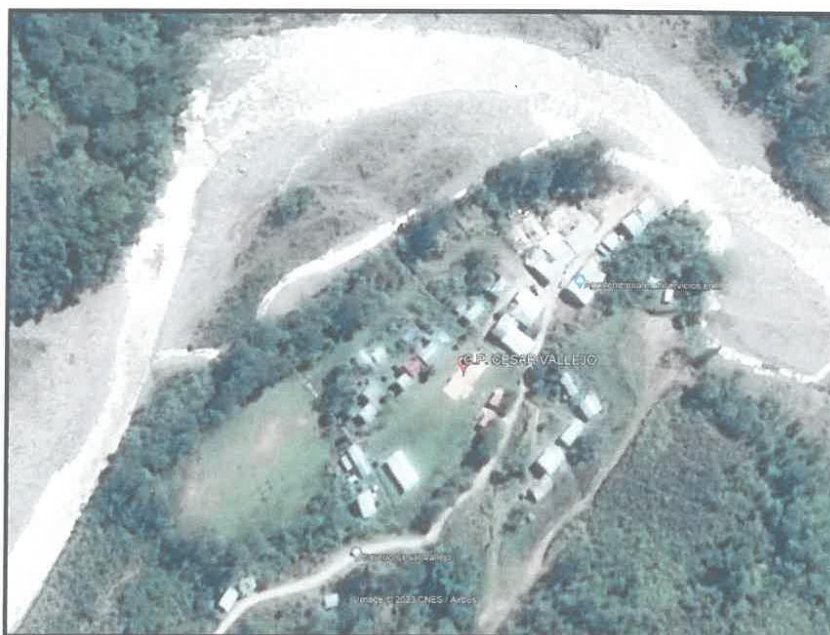
Mapa de Ubicación del Centro Poblado de Cesar Vallejo; y al Norte se aprecia el Rio Tutumayo