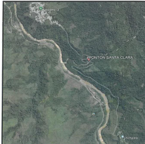
Mapa de Ubicación del Pontón Santa Clara; y el Cauce a Cruzar es el Rio Santa Clara