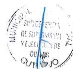
Figura N° A3: Ubicación Geográfica: Provincia de Cutervo