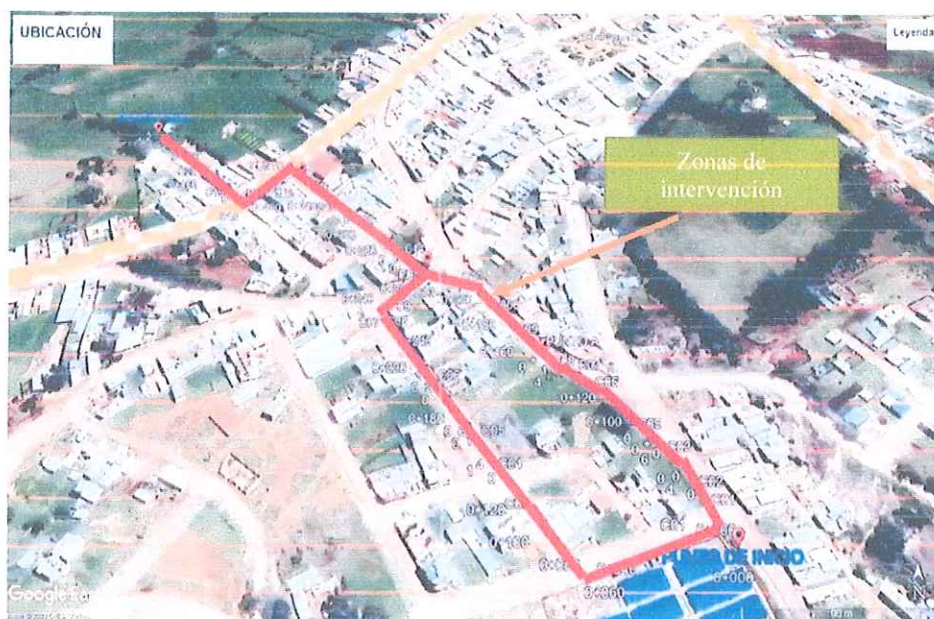
Figura N°A4: Ubicación Geográfica: Proyecto