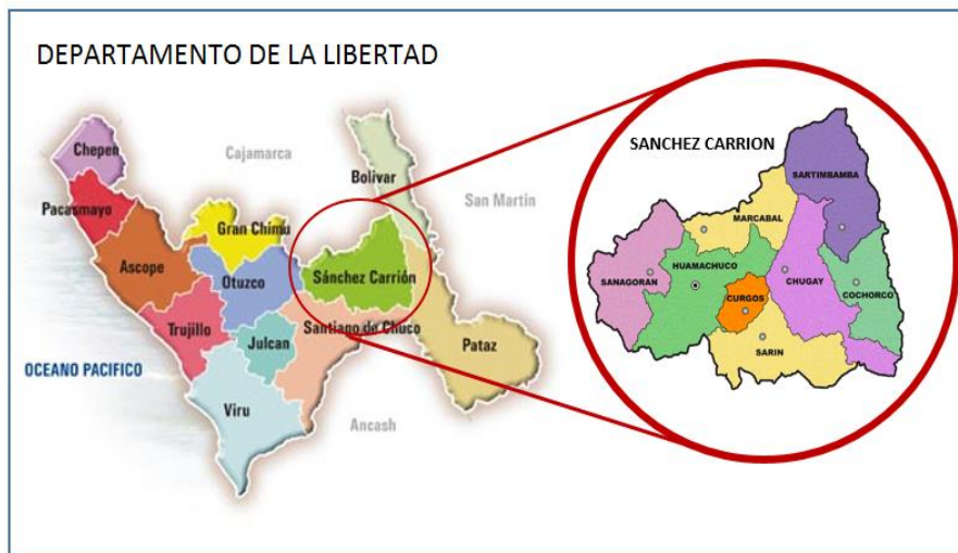
IMAGEN 03. UBICACIÓN GEOGRÁFICA DEL DISTRITO DE HUAMACHUCO