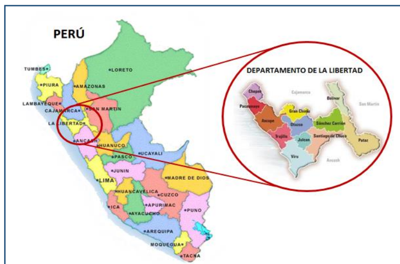
IMAGEN 01. UBICACIÓN GEOGRÁFICA DE LA REGIÓN LA LIBERTAD

Región geográfica : Sierra Coordenadas UTM : Zona 17 826129.37 E 9134280.97 N