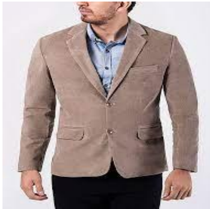
IMAGEN REFERENCIAL DEL SACO EN CORDUROY

MUESTRA: Para la presentación de la muestra física del uniforme de caballero (saco y pantalón), esta muestra debe cumplir con las especificaciones técnicas, la muestra se realizara en talla “M” el cual deberá ser presentado en la UGEL PUQUIO , un día (01) antes de la presentación de la propuesta electrónica . El no cumplimiento de las especificaciones técnicas en la confección del terno se considerará como NO ADMITIDA LA PROPUESTA.