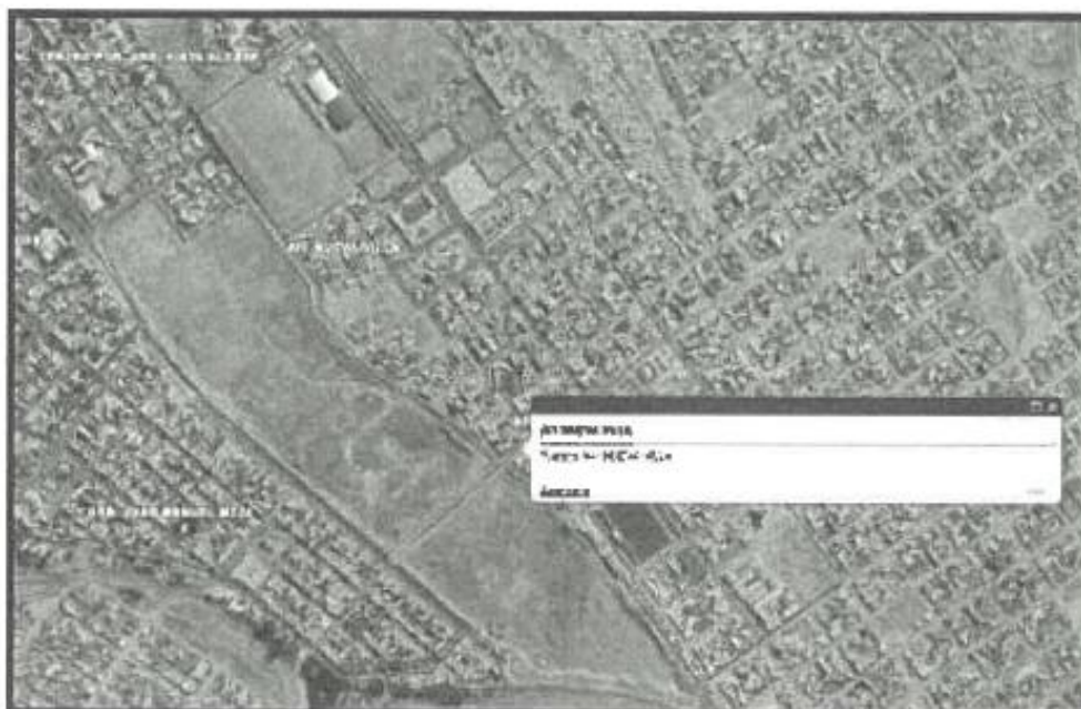
Figura N°2: Vista de ubicación del Parque Nueva Villa