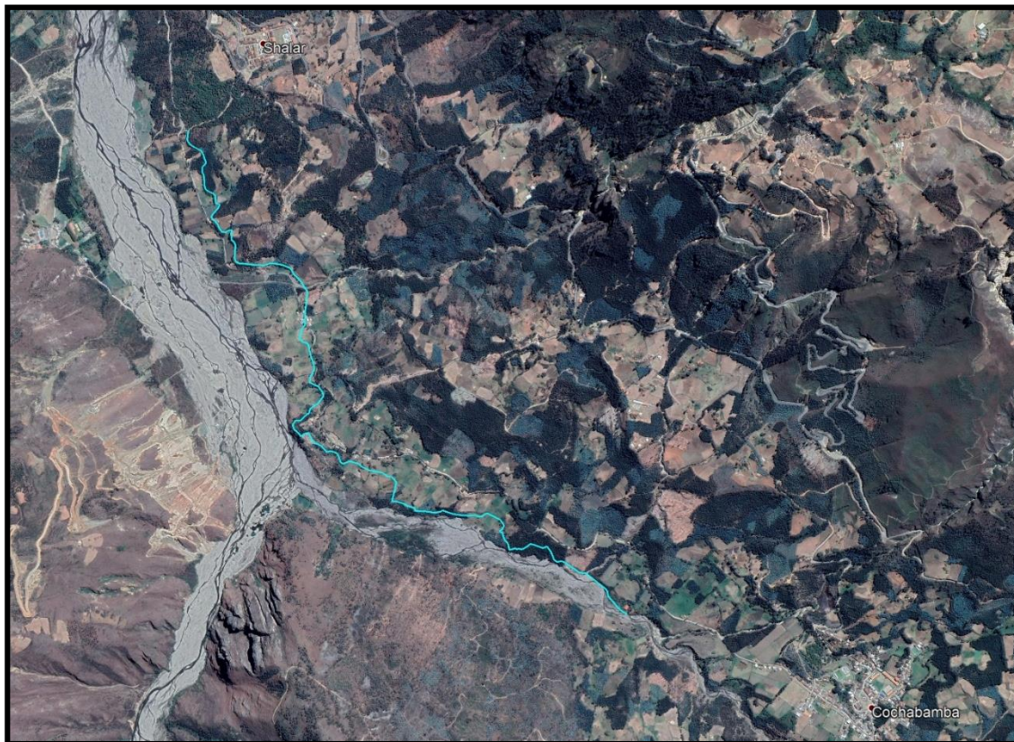
Ilustración: Imagen satelital del Canal Rio Negro del caserío de Shalar